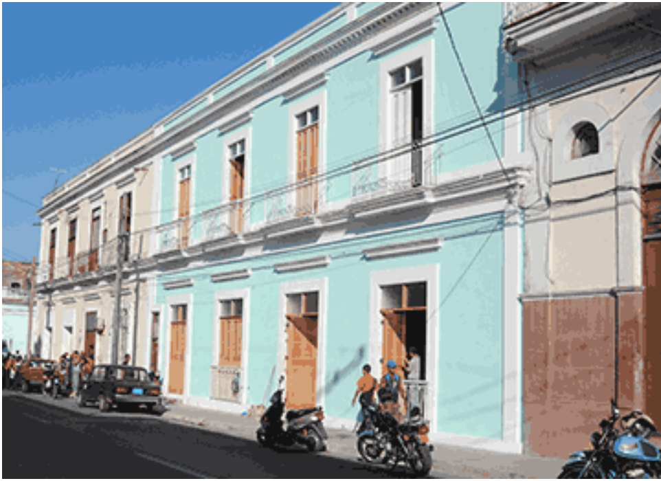
Fachada actual de la Escuela de Oficios para la Restauración Joseph Tantete Dubruiller

Periodista. Oficina del Conservador de la Ciudad