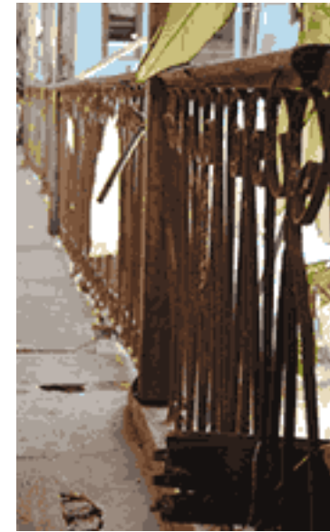
Aspecto actual del antiguo hotel La Suiza, detalle de un balcón.

ble labor social de su esposo: el único cementerio jardín de Cuba, necrópolis bautizada con el nombre del hijo amado, Tomás Acea, aunque en el sagrado vergel no reposen sus huesos ni los de los suyos.