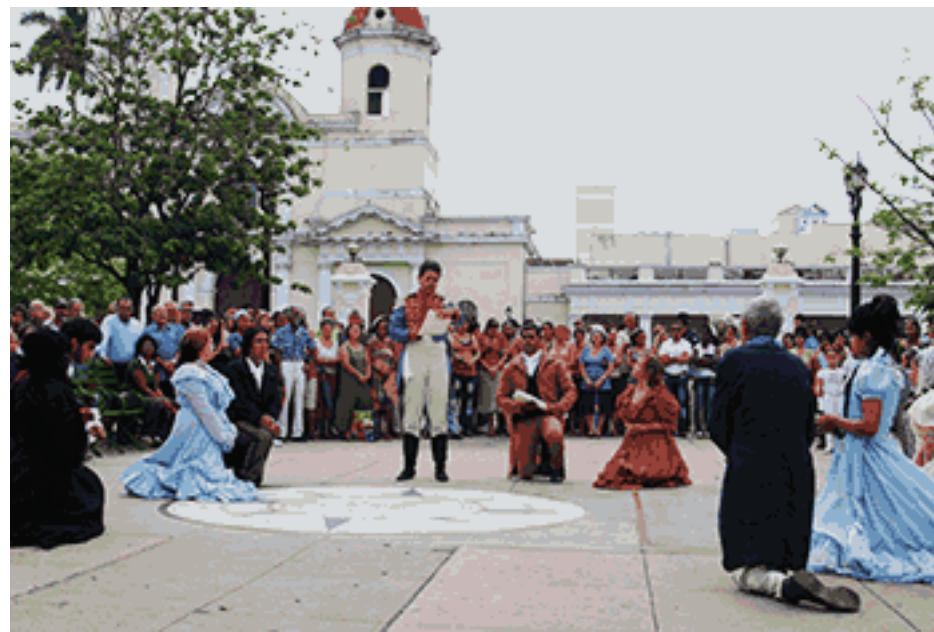
Acto de Evocación de la ciudad de Cienfuegos

El mencionado conjunto vocal cuenta con una historia dedicada a desarrollar y fomentar la música cubana y local, mediante bellas melodías, en tanto Manuel, es una figura muy querida en la ciudad por su contribución a enriquecer