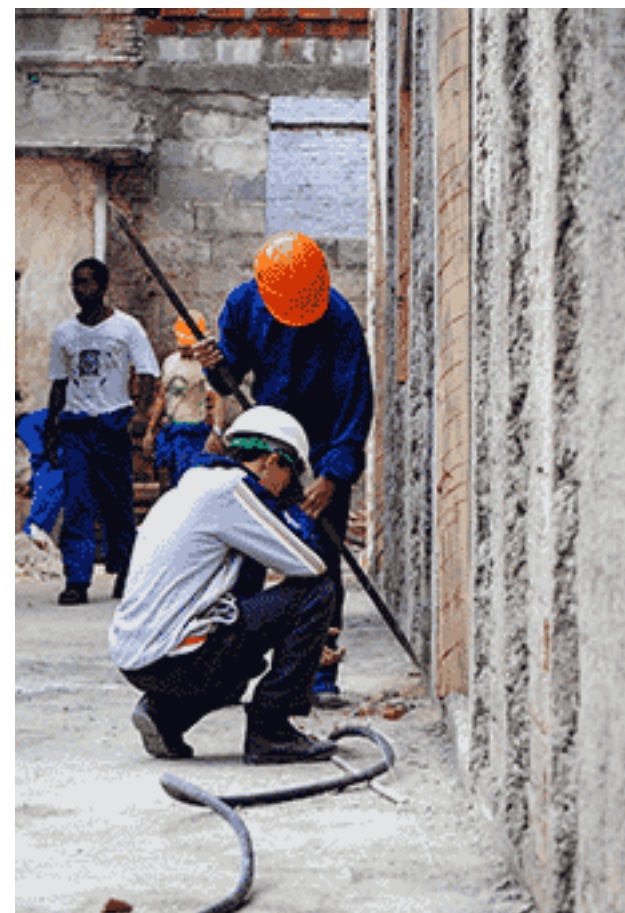
Construcción del patio La Alhambra en la que trabajan estudiantes y profesores de la Escuela de Oficios para la Restauración Joseph Tantete Dubruiller.