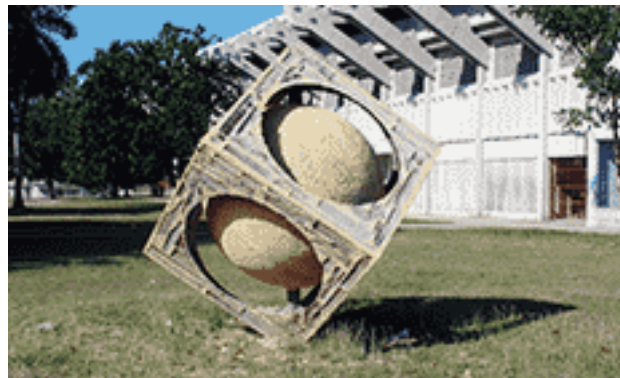
Arriba De la tierra , en el Parque de las Esculturas, abajo Redonda y viene en caja cuadrada , en el estadio 5 de septiembre, ambas en Cienfuegos.

servicio de una creación que se identifica con el fino humor de la cultura popular, patrimonio de las multitudes concurrentes a semejante escenario.