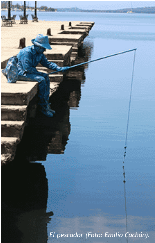
El pescador (Foto: Emilio Cachán).

La identidad de un pueblo no sólo tiene expresiones tangibles, la identidad de un pueblo también se conforma de los saberes heredados, la cosmogonía construida por sus predecesores, así como las diferentes variantes de su cultura que incluye: oralidad, lengua y artes entre otras expresiones, imaginario colectivo en constante evolución y desarrollo.