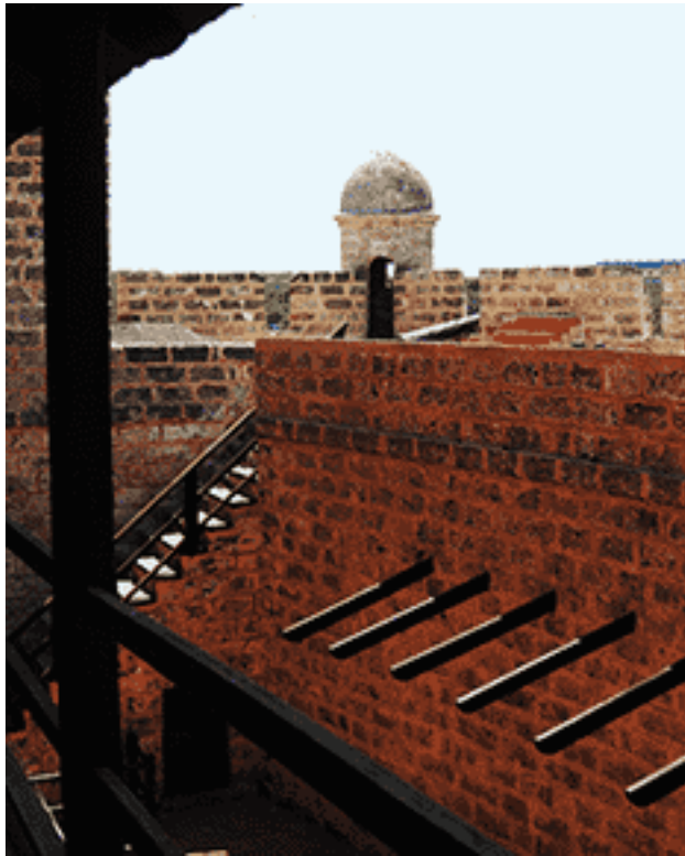
Fortaleza Nuestra Señora de los Ángeles de Jagua (Foto: Nelson Costa).

Inicialmente, el asentamiento aborígen localizado en las inmediaciones de la bahía de Jagua, más tarde, los primeros estancieros y europeos radicados extramuros de la dieciochesca fortaleza Nuestra Señora de los Ángeles de Jagua, dieron lugar a lo que actualmente se reconoce como la comunidad Castillo de Jagua, cuyas tradiciones marineras también han realizado un sustancial aporte al reconocimiento de una identidad local de variopintas expresiones.