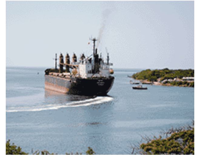
Bahía de Jagua.

utilizadas, díganse, las llamadas “cachuchas”, y las comidas que sostienen a los pescadores durante el proceso, entre las que sobresale la “muga o miroldo”–.