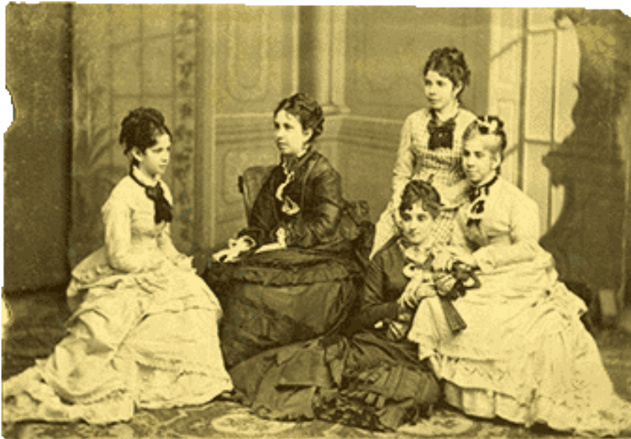
Fotografía tomada por don Jacinto de la Coteria en el estudio de la calle Santa Carlos No. 37.

En 1839, a veinte años de fundada la colonia Fernandina de Jagua, se patentaba en Europa uno de los inventos que revolucionó el siglo XIX: la fotografía. Muy impresionados debieron quedar los fotografiados al ver sus imágenes en diferentes soportes, lo cual presentaba a los fotógrafos como una suerte de magos, hombres de avanzada. Los mejores trajes, regias posiciones, accesorios