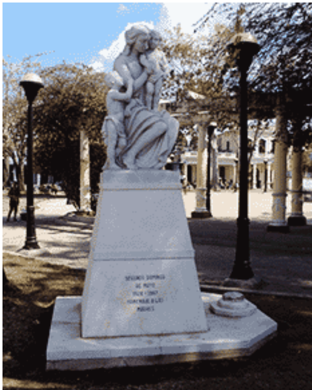
Conjunto escultórico de mármol (1967) dedicado a todas las madres. Parque Enrique Villuendas de Cienfuegos.

biental. Los gestores de la idea en este caso, fueron las logias Asilo de la Virtud, Federico Capdevila, Hijas de la Acacia No.32 y Ajefs Aurora de Cienfuegos, representadas por su comisión de trabajo Pro erección del monumento a las madres.