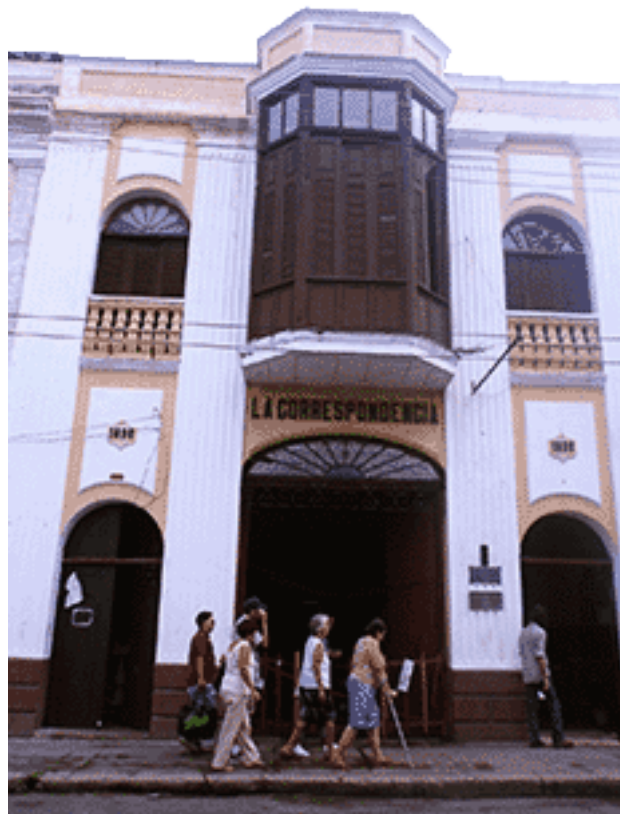
Fachada de la Imprenta Mártires de Barbados.

Hoy, imprenta Mártires de Cienfuegos y perteneciente a la Empresa de Producciones al Mercado y la Exportación (PAMEX), atesora maquinarias algunas de más de una centuria de explotación y que llegan funcionando a nuestros días gracias al sentido de pertenencia de aquellos usuarios que las operan. Sin piezas de repuesto y con una tecnología totalmente obsoleta, se imprimen allí modelos del Sistema Nacional de Contabilidad y otros