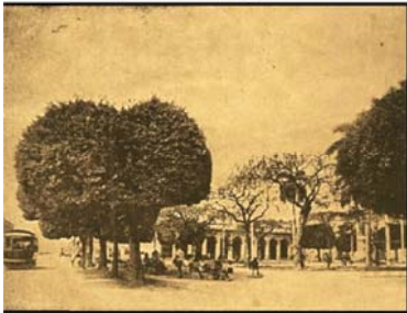
Casa Consistorial y Parque José A. Echeverría. Número especial que la revista Bohemia dedica a Cárdenas, 1916.

Es la época en que ya aparecen cualificadas las tipologías constructivas de la ciudad, o sea, las casas de mampostería, las de mampostería alta, de mampostería alta y zaguán de mampostería alta y azoteas, la de mampostería baja y que distinguirán a la ciudad en todo su conjunto pero muy principalmente en su área fundacional.